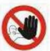
Divieto di accesso alle persone non autorizzate