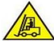
Carrelli di Movimentazione