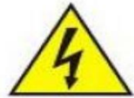
Tensione elettrica pericolosa