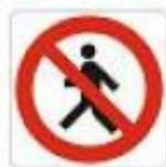
Vietato ai pedoni