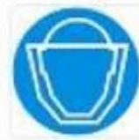
Protezione obbligatoria del viso