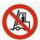
Vietato ai carrelli di movimentazione