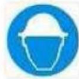
Casco di protezione obbligatoria