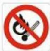
Vietato fumare o usare fiamme libere