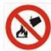
Divieto di spegnere con acqua