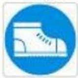
Calzature di sicurezza obbligatoria