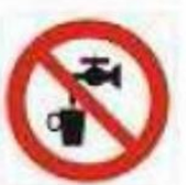
Acqua non potabile