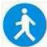
Passaggio obbligatorio per i pedoni