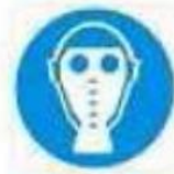
Protezione obbligatoria delle vie respiratorie