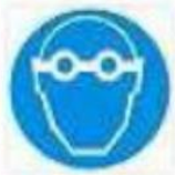
Protezione obbligatoria degli occhi