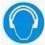
Protezione obbligatoria dell'udito