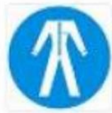
Protezione obbligatoria del corpo