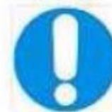
Obbligo generico (con eventuale cartello supplementare)