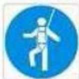
Protezione individuale obbligatoria contro le cadute