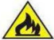
Materiale infiammabile o alta temperatura (1)

(1) In assenza di un controllo specifico per alta temperatura .