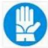
Guanti di protezione obbligatoria