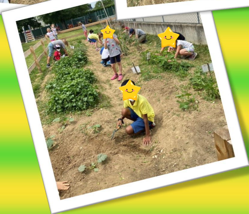
I bambini curano il terreno dell'orto.