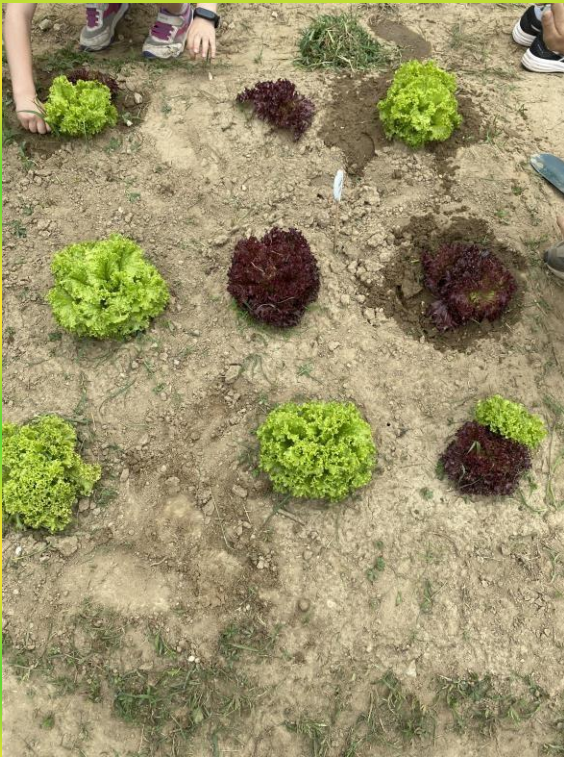
Lattuga Lollo Rossa e Verde